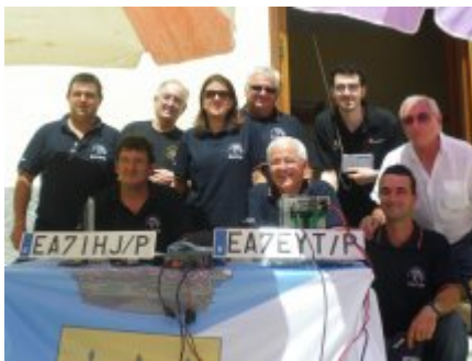
Foto de grupo

El 14 por la mañana se unieron más colegas pasando todos un inolvidable fin de semana ya que contribuyó el buen tiempo y una excelente temperatura como es asiduo en la zona. Finalizamos las transmisiones sobre la una del medio día alcanzando un Log de 185 QSO,s. Todos los contactos realizados se confirmarán vía buró al propio indicativo válido también para el D.M.E ref. 04.006.