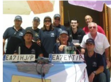
Foto de grupo

La actividad dio comienzo sobre las ocho de la mañana del sábado, con el montaje de equipos y dipolo para 40m, con algunos problemas de ajuste en la antena siendo solucionados poco después. Se hicieron las primeras pruebas de emisión con el indicativo EA7IHJ/P que contó con la presencia y participación de distintos colegas EA7EYT , EA7IJD , EA7AYS , EA7IOT EA7HMP , EA7HKB y EA7IFT .